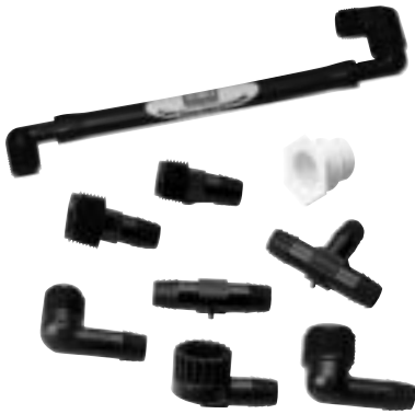
Acessórios Super Funny Pipe

Este tubo exclusivo serve para efectuar extensões entre a tubagem do sector e o aspersor ou pulverizador, permitindo ao instalador colocar o equipamento de aspersão no ponto exacto com máxima comodidade. Mesmo os super-emergentes (hi-pops) instalados em locais de difícil acesso deixam de ser problemas.