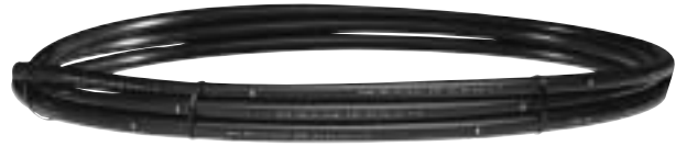
Super Funny Pipe

O produto Super Funny Pipe é um tubo de polietileno robusto que resolve os problemas na instalação ou substituição de aspersores. Basta inseri-lo no aspersor e na tomada de carga, com a sua flexibilidade pode colocar o aspersor na posição ideal – mesmo em zonas de difícil aproximação.