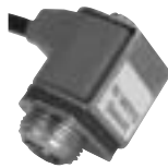
Conjunto de solenoide CC