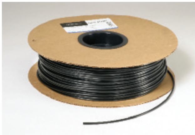
N° de pieza EVR0332-250

©2014 The Toro Company Micro-Irrigation Business 1588 N. Marshall Avenue, El Cajon, CA 92020-1523, USA Tel: +1 (800) 333-8125 or +1 (619) 562-2950 Fax: +1 (800) 892-1822 or +1 (619) 258-9973