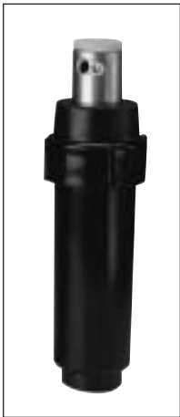
Série 640 Check-O-Matic

Modèle avec indicateur d'eau recyclée disponible